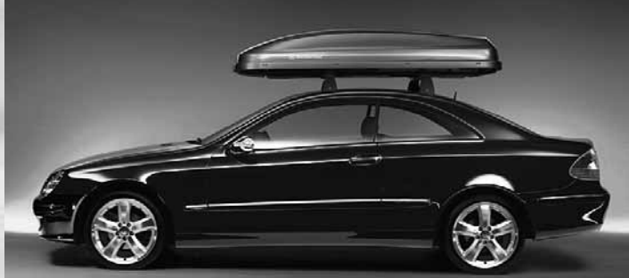
◀ Grundträger Alustyle, Mercedes-Benz Dachbox