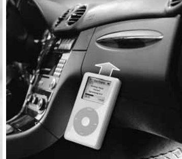
iPod Interface Kit ▶