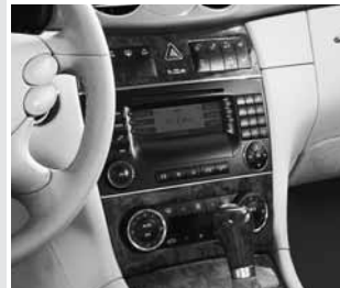
▲ Lederlenkrad/-schalt hebel