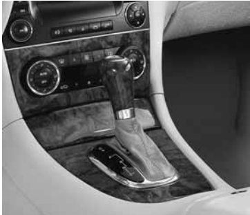
▲ Schalt-/Wählhebel in Holzausführung