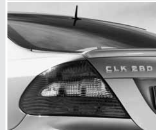
▲ AMG Abrisskante