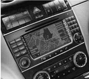
◀ »COMAND APS«