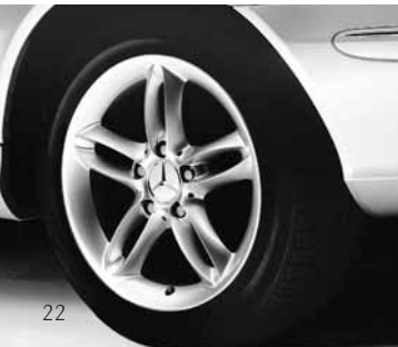
◀ Aldebaran, 5-Doppelspeichen-Design