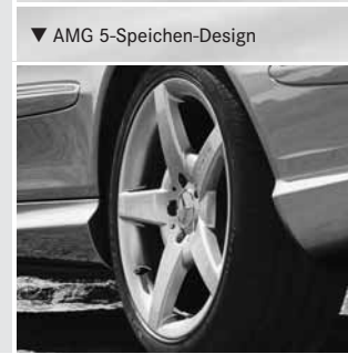
▼ AMG 5-Speichen-Design