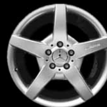
▲ 5-Speichen-Design AMG