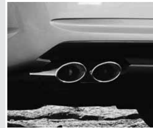
▲ AMG Doppelendrohr