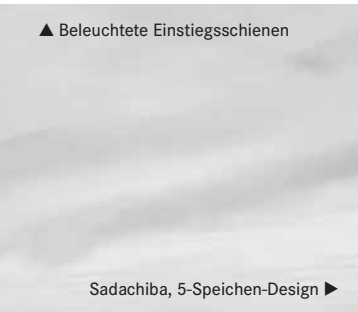
Sadachiba, 5-Speichen-Design ▶