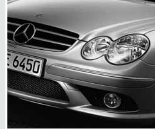
▲ AMG Frontschürze