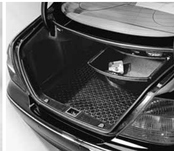
Kofferraumwanne, flach, Schublade unter Hutablage ▶