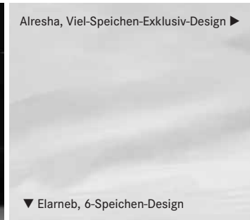
▼ Elarneb, 6-Speichen-Design